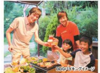
BBQバイキングイメージ