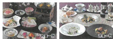
当施設追加除外日:金・土・日曜日、5/7~10(休館日)、7/14~20