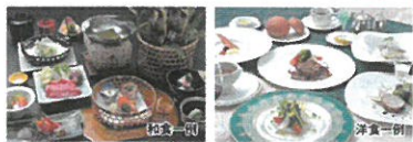
当施設追加除外日:土曜日、休前日