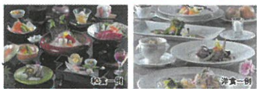
当施設追加除外日:6/20・21(休館日)