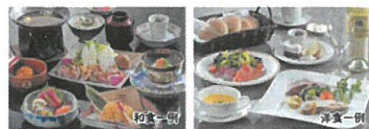
当施設追加除外日:週末バイキング提供日